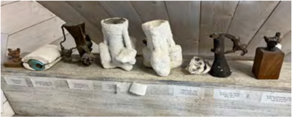
Hela processen från modell till färdig skulptur finns beskriven i Björns utställningshall.