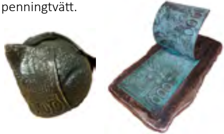
"Tennisproffs" och "Making money" var två av verken på vårsalongen.