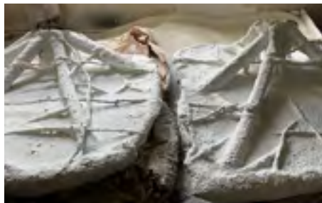
Vax och gjutkanaler täckta av flera omgångar keramisk slurry.

En modell av den tänka skulpturen görs i vax som sedan i omgångar får ett hölje av en flytande keramisk slurry.