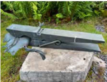
"Brusten lina" – ett vardagligt ting i ny kontext.

Det blir uppenbart i verket med ett handfat av betong med bronsavgjutningar av tandborste och tandkräm där de få föremålen på hans sida av handfatet ställs mot en mängd krämer, burkar, läppstift, sprayburkar och oljor på hennes sida.