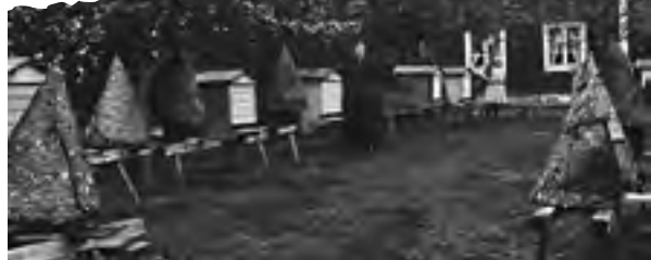
Hilding Aronssons Affärsfastighet, Kråksmåla 1926