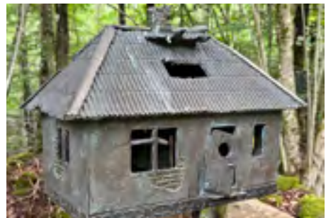
"Hus i Ølgod?" är en bland många sevärda skulpturer längs skulpturstigen.

Landets enda skulpturstig har skapats av Björn och är belägen intill verkstaden. Den är öppen för alla och innehåller mängder av finurliga och roliga verk, väl värd ett besök och rundtur.