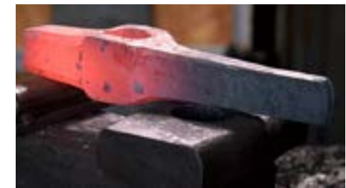
En långnosig skärmejsel på städet, ett bland många verktyg som tillverkats i smedjan.