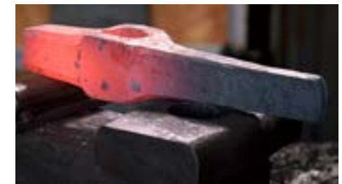
En långnosig skärmejsel på städet, ett bland många verktyg som tillverkats i smedjan.