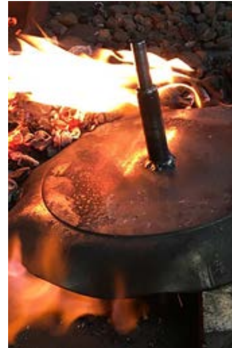
Tillverkningen av stekpannan krävde många moment, både maskinellt och smide.

Med vana att söka information på internet fann han inspiration från likar runt om i världen. Det i sin tur ledde till att