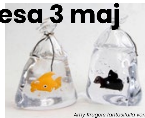
Amy Krügers fantasifulla verk

järnbruk och smedja startade på 1700-talet och glashantering när järnhanteringen inte var lönsam i slutet på 1800-talet.